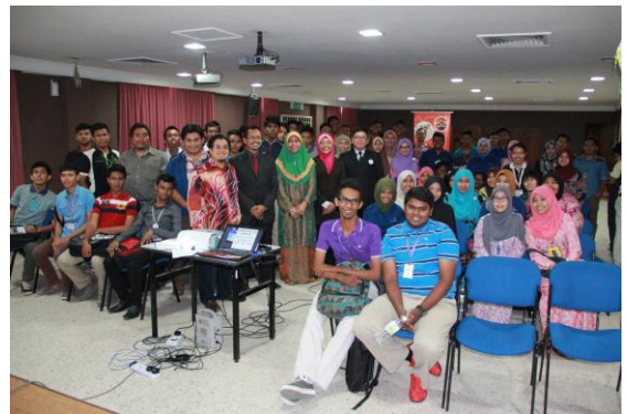
Para pelajar bergambar kenangan bersama AMPAC Coach dan Pensyarah yang terlibat.