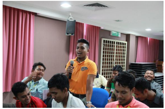
Sesi soal jawab di antara pelajar dan AMPAC Coach.