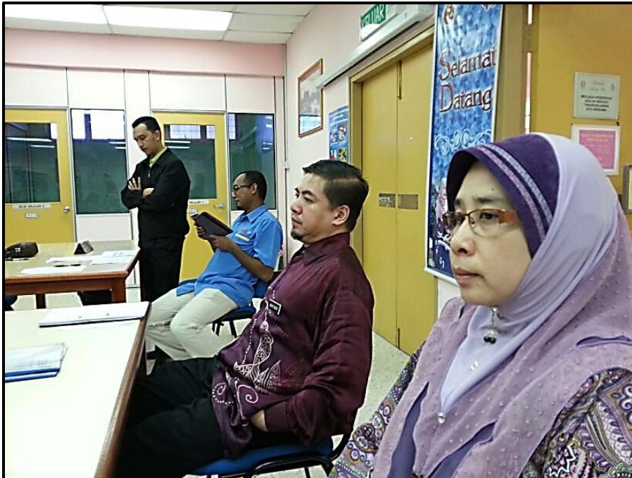
Figure 3 : AJK Pelaksana program