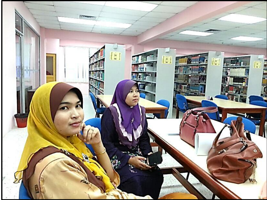
Figure 4 : AJK Pelaksana Program