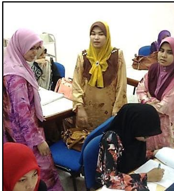
Figure 7 : Fasilitator memantau kumpulan pelajar