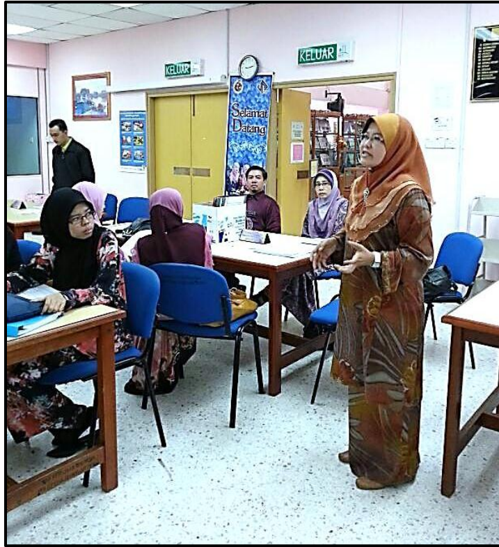
Figure 1: Ketua Jabatan memberi ucapan pendahuluan