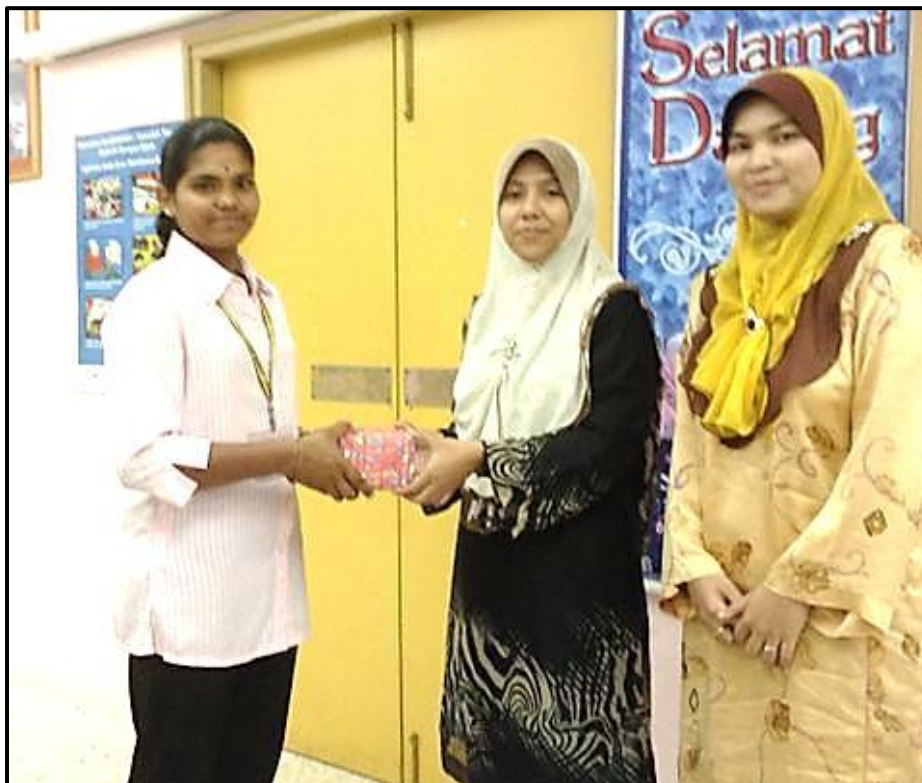
Figure 9 : Ketua Program Sains memberikan cenderamata kepada mentor