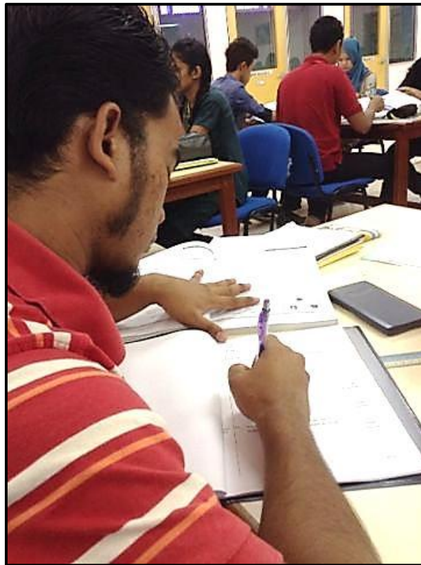
Figure 5 : Sesi perbincangan