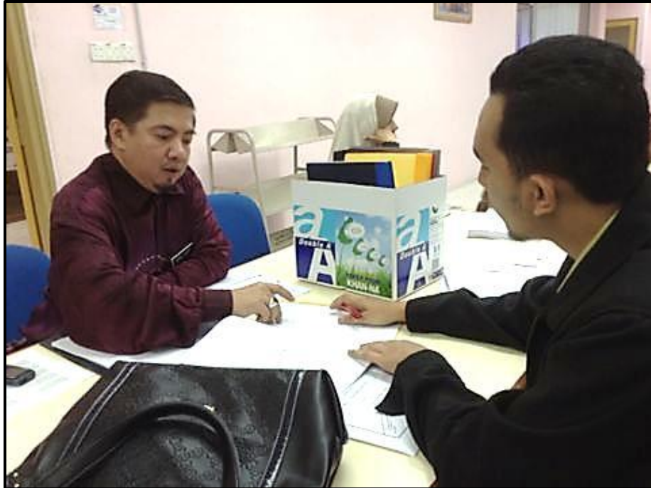
Figure 8 : Fasilitator berbincang mengenai skema jawapan