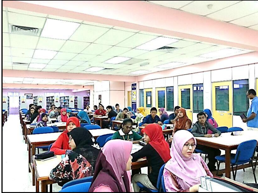
Figure 2: Sesi pembahagian kumpulan